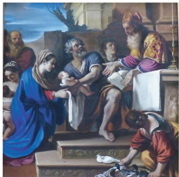
Guercino (1591–1666), Die Darstellung Jesu im Tempel, 1623

Was sagt uns dieses Fest heute? Zunächst, dass Maria, Josef und durch sie auch Jesus tief im jüdischen Glauben verwurzelt waren. Das hat die Kirche zu oft in ihrer Geschichte vergessen. Zweitens: Dass alle Menschen, unabhängig von Geschlecht und Geburtsreihenfolge, Gott gehören – wir leben in einer tiefen Beziehung zu ihm. Weil Maria und Josef ihren Sohn Gott geweiht haben, ist in der katholischen Kirche der 2. Februar zugleich der Tag des geweihten Lebens; allen Menschen gewidmet, die ihr Leben dem Glauben in besonderer Weise geweiht haben. Ein Aspekt des Festes blieb bis jetzt unerwähnt. Josef und Maria begegnen im Tempel Simeon und Hanna, die ein Leben lang auf den Messias gewartet haben und Jesus jetzt als den Retter und Erlöser identifizieren.