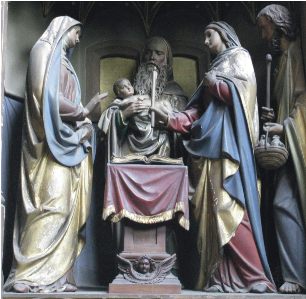
Darstellung des Herrn - Mariä Lichtmess